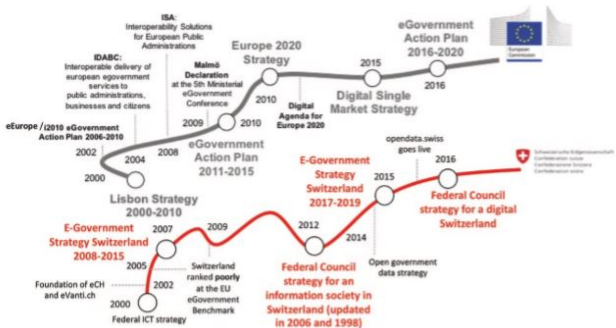
Fig. 10.1 A brief history of e-government in the EU and Switzerland